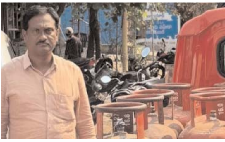
నమోదు చేస్తామని తెలిపారు. అదేవిధంగా, అన్ని వ్యాపార సంస్థలు ప్రభుత్వ నిబంధనలు మరియు మార్గదర్శకాలను ఖచ్చితంగా పాటించాలని ఆయన సూచించారు.