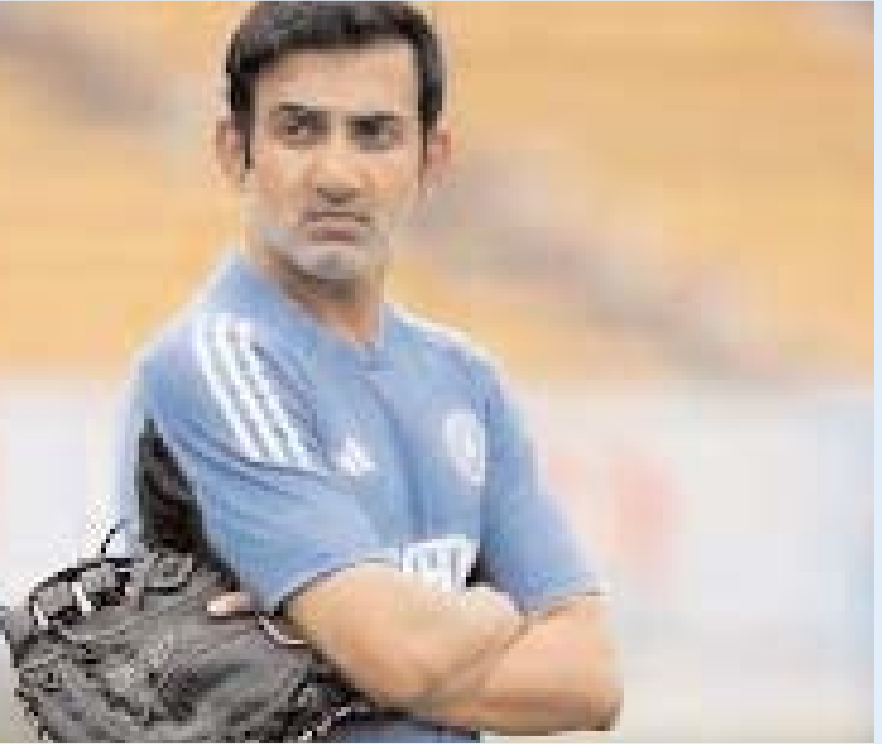
తర్వాత నేను కోల్కతా జట్టు మెంటార్ గా బాధ్యతలు చేపట్టాను. ఆ

కోల్కతా నైట్ రైడర్స్ (కేకేఆర్) ప్రాంచైజీతో తనది విడదీయని బంధమని టీమిండియా హెడ్ కోచ్ గౌతమ్ గంభీర్ తెలిపాడు. కేకేఆర్తో తనకు అద్భుతమైన, కెప్టెన్గా, కోచ్ గా తన ప్రత్యేకమైన గుర్తింపును తెచ్చిపెట్టినా ఉన్నాడు. అసలు తాను టీమిండియా హెడ్ కోచ్ గా బాధ్యతలు చేపట్టడానికి ప్రధాన కారణం కేకేఆర్ అని గంభీర్ స్పష్టం చేశాడు. ఐసీసీ టీ20 ప్రపంచకప్ 2026లో భారత్ విజేతగా నిలవడంలో హెడ్ కోచ్ గా గౌతమ్ గంభీర్ కీలక పాత్ర పోషించాడు. టీమ్ సెలెక్షన్ నుంచి మైదానంలో అమలు చేసే వ్యూహాల వరకు అన్నీ తానే నడిపించాడు. దాంతో అటాకాశ్.. కోచ్ గా టీ20 ప్రపంచకప్ గెలిచిన ఘనతను అందుకున్నాడు. అంతేకాకుండా భారత జట్టుకు రెండు ఐసీసీ ట్రోఫీలు అందించిన ఏకైక కోచ్ గా గంభీర్ చరిత్రకెక్కాడు. తాజాగా ఓ వానెట్ కు ఇచ్చిన ఇంటర్వ్యూలో భారత జట్టు కోచ్ గా బాధ్యతలు చేపట్టడంలో కేకేఆర్ ప్రాంచైజీ కీలక పాత్ర అని గంభీర్ తెలిపాడు. ' 7-8 ఏళ్ల నుండి విరామం