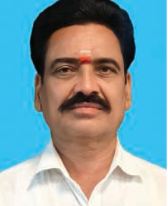
బలపడమే కాకుండా, గ్రామీణ ఆర్థిక వ్యవస్థకు కూడా ఊతమిస్తుందని తెలిపారు.

సదుపాయాల లోపం వల్ల రైతులు ఇబ్బందులు ఎదుర్కొంటున్నారని ఆయన పేర్కొన్నారు. జిల్లాలో పండ్లు, కూరగాయలు వంటి త్వరగా పాడయ్యే ఉత్పత్తులు విస్తృతంగా పండుతున్నాయని, సరైన కోల్డ్ స్టోరేజ్ సదుపాయం లేకపోవడంతో అవి త్వరగా నాశనం అవుతున్నాయని తెలిపారు. దీంతో రైతులు తమ ఉత్పత్తులను తక్కువ ధరలకు అమ్మాలిని పరిస్థితి నెలకొంటోందని ఆవేదన వ్యక్తం చేశారు. శీతల గిడ్డంగుల ఏర్పాటుపై పంటలను ఎక్కువ