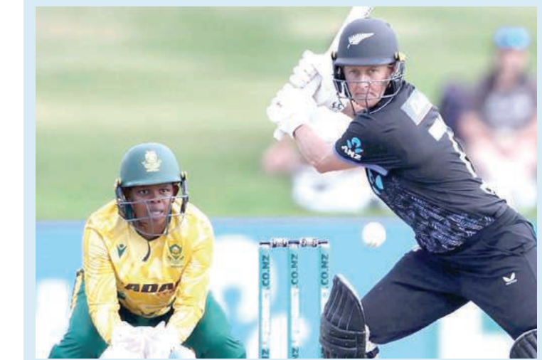
దక్షిణాఫ్రికాపై న్యూజిలాండ్ గెలుపు సిరీస్ కైవసం