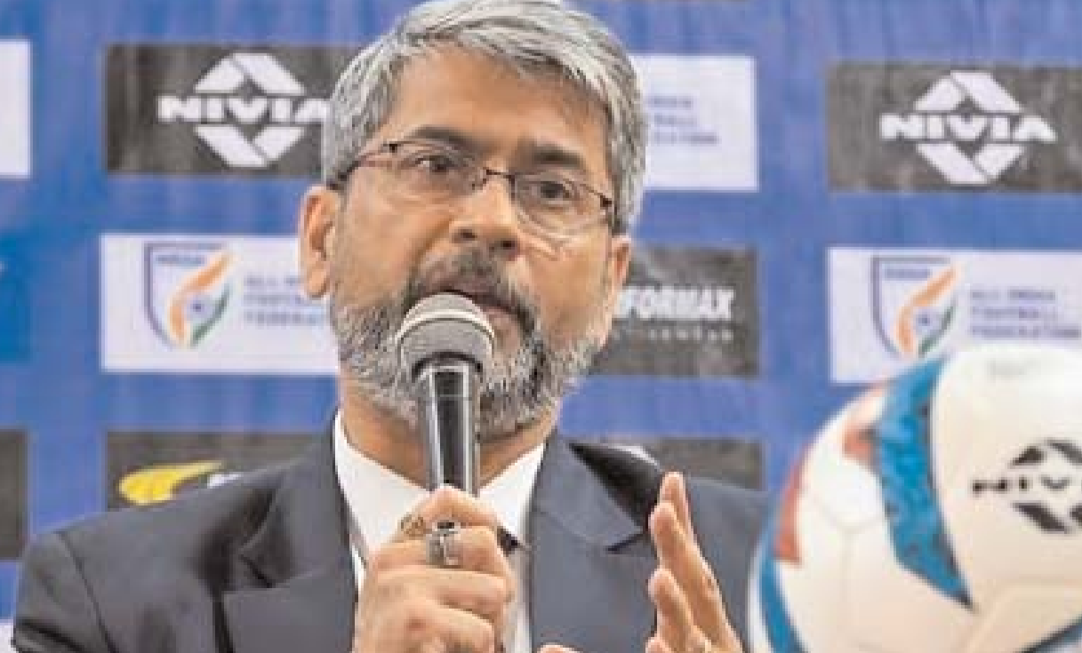
నడిపించారు. ఫిఫా మహిళల ఫుట్ బాల్ డెవలప్ మెంట్ కమిటీ 2029 వరకు ఆ హోదాలో కొనసాగుతారు. సభ్యులగా నియమితులైన తొలి భారతీయురాలిమే. 2025 నుంచి