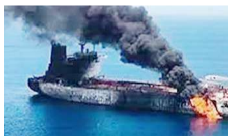
ఇరాన్ దాడిలో కాల్పోతున్న అమెరికా ట్యాంకర్

వాషింగ్టన్, మార్చి 5 (నినాదం): పశ్చిమాసియాలో పెరుగుతున్న ఉద్రిక్తతల నడుమ అమెరికా భారీ అణు సామర్థ్యం గల క్షిపణి పరీక్ష నిర్వహించడం ప్రపంచం దృష్టిని ఆకర్షించింది. అమెరికా సైన్యం కాల్ ఫోర్ రియో తీరంలో ఉన్న వాండెన్ బర్గ్ స్పెస్ ఫోర్స్ బేస్ నుంచి శక్తిమంతమైన మినీమాన్-3 ను విజయవంతంగా ప్రయోగించింది. ఈ పరీక్షను అమెరికా సాధారణ కార్యక్రమంలో భాగంగా నిర్వహించినది అధికారులు వెల్లడించారు.