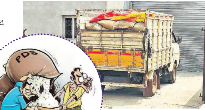
పేదల హక్కులపై దాడి రేషన్ బియ్యం అక్రమ రవాణా కేసుల అధిక నేరం మాత్రమే కాదు—ఇది పేదల హక్కులపై నేరుగా దాడి. ప్రభుత్వం సబ్సిడీతో అందించే దాస్యం మార్కెట్ కు మళ్లిపోతే నిజమైన లబ్ధిదారులే స్వప్నో తారు. కొంతమంది అక్రమ మార్కెట్ లాభం కోసం బలహీన వర్గాలు స్వప్నోపదం అనాయం.

పేదల కోసం ప్రభుత్వం అటులు చేస్తున్న ప్రజా పంపిణీ వ్యవస్థ (పిడిఎన్)లో ఆగుతున్న అక్రమంగా మరోసారి వెలుగులోకి వచ్చాయి. మెట్పల్లి పట్టణంలో రేషన్ బియ్యం అక్రమ రవాణా బస్సుల గంగానే సాగుతోందన్న ఆరోపణలు సాగుతున్నాయి. రేషన్ షాపుల వద్ద మద్దతు రులు పడిపోయి కాస్తా, కొంతమంది డీలర్ల సహకారంతో లబ్ధిదారుల నుంచి బియ్యం కొనుగోలు చేస్తున్నట్లు సమాచారం. ప్రభుత్వం సబ్సిడీతో పేదలకు అందించాల్సిన బియ్యం బ్యాక్ మార్కెట్ కు మళ్లిపోతుండటం ఆరోపణలు చేశారు. రెవెన్యూ, సిబిల్ స్వయం శాఖల పర్యవేక్షణ లోపంతో దండదారులు మరింత ద్రోహంగా వ్యవహరిస్తున్నారన్న విమర్శలు వినిపిస్తున్నాయి.