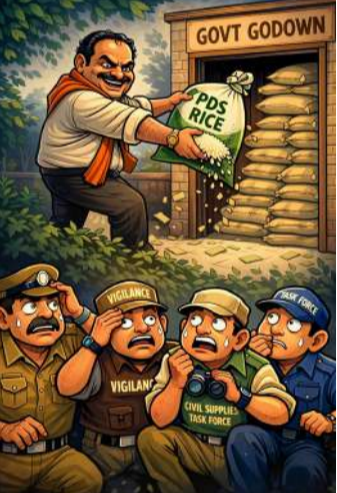
కనపించని సిఎంఆర్ ల చీటర్.. రాష్ట్ర వ్యాప్తంగా సివిల్ సప్లై శాఖలో వేల కోట్ల విలువగల సిఎంఆర్ బాకీలు పెరుకు

చిల్లర కొట్టు స్థాయి నుండి కేవలం 8 ఏళ్ల కాలంలో కోట్ల గడించాడని, అది రేషన్ బియ్యం స్పీగ్ లో తోనే అని సంబంధిత స్థానిక అధికారులందరికీ తెలుసుని స్థానికులు చెబుతారు. అక్కడి జనమే కాదు ప్రతీ చెట్టూ, పుట్టూ, గాలి, నీరు నుండి సైతం ఇదే నిజమనే బలమైన సమాధానమొస్తుంది. ఇదే నేరంపై అధికారులు మొదట్లో ఓసారి పీడీ యాక్టు సైతం ప్రయోగించారట. అయినా ఏమాత్రం మారకుండా నిత్యం బియ్యం స్పీగ్ లో చేస్తూ మరో వీరప్పన్ ను తలపెట్టుతున్నాడు.