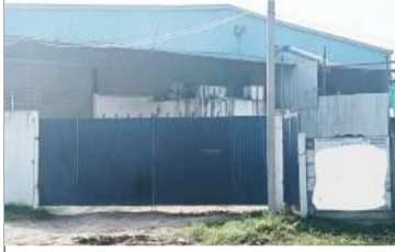
తీర్చి అరోపాలు ఎదుర్కొంటున్న ఓ మిల్లు

కక్కకు కట్టినట్లు మీడియా చూపుతున్నా, నిజాయితీగల అధికారులు కావాలా కాస్తూన్నా, చివరకు ముఖ్యమంత్రి ఆదేశించినా కాక నగర్ లో రేషన్ మాఫియా మాత్రం ఆగటంలేదు. ప్రముఖంగా ఓ