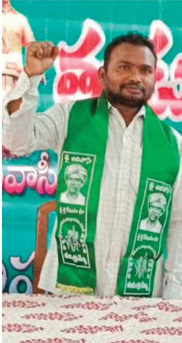
సమస్యల పరిష్కారం కోసం ధర్మాలు, రాసారో కోలు నిర్వహించి, తహసీల్దార్ కు వినతిపత్రాలు

2000లో ములుగు గ్రామ కమిటీ అధ్యక్షుడిగా బాధ్యతలు చేపట్టి ఆదివాసీ గ్రామాల్లో చైతన్యం కల్పించారు. యువతను ఉద్యమాల వైపు దారితీస్తూ హక్కుల కోసం పోరాడాలని పిలుపునిచ్చారు. ఆయన సేవలను గుర్తించిన రాష్ట్ర కమిటీ 2013లో రాష్ట్ర ఉపాధ్యక్షుడిగా నియమించింది. అప్పటి నుంచి నిరంతరం జాతి సేవలో కొనసాగుతున్నారు.