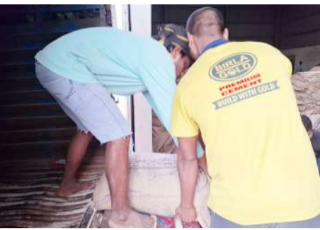
సానిక బ్యాగుల్లోంచి తీసి ఏసీబీకి నిర్ణయం చేస్తున్న పీడిఎస్

మిల్లర్ వ్యవహారాన్ని తీరు ఆసక్తిగా మారింది. వెరసి అధికారుల చర్యలలో వీరికి వరంగా మారినది సానికంగా అభిప్రాయం వ్యక్తమవుతోంది. కాగా ఇప్పటికైనా రాష్ట్ర స్థాయిలో ప్రభుత్వ బాధ్యులు దీనిపై దృష్టిసారించాలని సామాజికవారులు డిమాండ్ చేస్తున్నారు. ఇలా ఉండగా పట్టణంలోని పెద్దవారు సమీపంలో గల ఓ రైస్ మిల్లర్ బుధవారం పీడిఎస్ రైస్ అన్ లోడ్ చేసుకుంటున్న ఫోటో ఒకటి నినాదం కెమెరాకు చిక్కటం కొనసాగింది!.