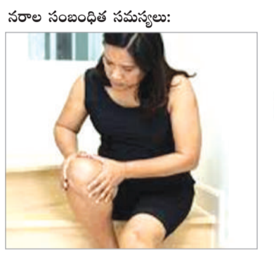
సరాల సంబంధిత సమస్యలు:

చిరుధాన్యాలలో కొర్రలు ఒకటి.. ఫైబర్, ప్రోటీన్, ఖనిజాలు పుష్కలంగా ఉండే కొర్రలు ఆరోగ్యానికి ఎంతో మేలు చేస్తాయి.. ఇవి మధుమేహం నియంత్రణకు, బరువు తగ్గడానికి, జీర్ణశక్తిని పెరుగుపరచడంలో అద్భుతంగా పనిచేస్తాయి.. అంతేకాకుండా సరాలకు బలాన్ని ఇచ్చి, రక్తపోషణను తగ్గిస్తాయి. డైటీషియన్లు ప్రకారం.. కొర్రలు, ఆంగులలో ఫాక్సిట్రో మిల్లెట్ లేదా ఇలాలియన్ మిల్లెట్ అని పిలిచే.. ఈ అద్భుతమైన నిరధాన్యం.. దాని విశేషమైన పోషక విలువలతో ఆరోగ్యాన్ని పెంపొందించడంలో ప్రముఖ పాత్ర పోషిస్తుంది. లేత పసుపు రంగులో ఉండే ఈ మిల్లెట్ ను గుర్తించడం సులభం. దీనిలో దాదాపు 8% ఫైబర్ ఉంటుంది. ఇది జీర్ణవ్యవస్థ పనితీరుకు తోడ్పడటమే కాకుండా, రక్తంలో చక్కెర స్థాయిలను నియంత్రించడంలో సహాయపడుతుంది. బరువు నిరధాన్యాలలో కొర్రలు అత్యంత సమతుల్యమైన పోషకాలను అందిస్తాయని నిపుణులు పేర్కొంటున్నారు.