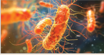
పరిస్థితిని వేగంగా పెంచుతున్నాయి.

ధర్మపురి, మార్చి 25 (నినాదం): దేశంలో యాంటిబయోటిక్స్ ప్రభావం తగ్గిపోతున్న పరిస్థితి వైద్య రంగాన్ని అంతోజనకు గురిచేస్తోంది. చిన్న ఇన్ఫెక్షన్లను సువి ప్రాణాపాయకమైన వరకు ఉపయోగించే యాంటిబయోటిక్స్ వనరులను పరిస్థితి ఏర్పడుతుండటం భవిష్యత్తులో పెద్ద ఆరోగ్య సమస్యగా మారుతుంది. ఈ పరిస్థితిని “యాంటిమైక్రోబయోటిక్స్ రెసిస్టెన్స్” అంటారు. దేశంలోని చెన్నై, ముంబై, కోల్కతా, ఢిల్లీ నగరాల్లో నిర్వహించిన తాజా శాస్త్రీయ అధ్యయనాలు ఈ సమస్య తీవ్రతను వెలుగులోకి తెచ్చాయి. ముఖ్యంగా మురుగునీటిలో యాంటిబయోటిక్స్ లోని “సూపర్ బ్యాక్టీరియా” పెరుగుతున్నట్లు గుర్తించారు. ఇక్కడ నుంచి ఆస్పత్రులు నుంచి, పరిశ్రమల నుంచి వచ్చే మురుగునీరు వివిధ రకాల సూక్ష్మజీవులకు కలయిక కేంద్రంగా మారి, బ్యాక్టీరియా ఒకదానితో ఒకటి జీన్స్ మార్చుకుంటున్న వేదికగా మారుతోంది. దీంతో యాంటి బయోటిక్స్ ప్రతిఘటన శక్తి వేగంగా పెరుగుతోంది.