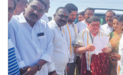
జమ్మికుంట, మార్చి 27 (నినాదం) : హాజరూబాద్ పట్టణంలోని

కాకతీయ కెనెల్ వద్ద డంపింగ్ యార్డ్ నిర్మాణం