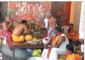
అని తెలిపారు. ధర్మాన్ని కాపాడేందుకు జీవితాన్ని అంకితం చేసిన మహానుభావుడిగా ఆయనను కొనియాడారు. హిందూ సమాజం