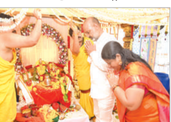
తరలివస్తున్న భక్తులతో ఆలయ ప్రాంగణం కిటకిటలాడు తోంది. భక్తులకు ఎలాంటి ఇబ్బందులు కలగకుండా చల్లదీ నీరు, మజ్జిగ పంపిణీ చేయడంతో పాటు ఎండ నుండి

కరీంనగర్, మార్చి 27 (నినాదం): కరీంనగర్ లోని శ్రీ మహాశక్తి ఆలయంలో శ్రీరామ నవమి వేడుకలు అంగరంగ వైభవంగా ప్రారంభమయ్యాయి. ఈ సందర్భంగా సీతారామ చంద్ర స్వామి విగ్రహాలను వధూవరులుగా అంకితం చేసి ప్రత్యేకంగా ప్రార్థించారు. ఆలయ మొత్తం ఆంధంగా ముహూర్తం, కళ్యాణ వేడుకలకు ప్రత్యేక ఆకర్షణగా నిలిచింది. వేద మంత్రోచ్ఛరణల సదుపాయం సీతారాముల కల్యాణం ఘనంగా కొనసాగింది. యజ్ఞోపవీతం నుంచి కన్యాదానం, జీలకర్ర-బెల్లం, తాలిబొట్టలు వరకు ప్రతి ఘట్టాన్ని వేద పండితులు వివరంగా భక్తులను అధ్యాత్మిక ఆనందంలో ముంచేతుకున్నారు. వేలాదిగా