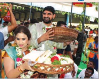
జమ్మికుంట, మార్చి 27 (నినాదం) అవర భద్రాద్రిగా పేరుపొందిన ఇల్లంతకుంట లోని శ్రీ సీతారామచంద్రస్వామి ఆలయంలో జరిగిన సీతారాముల కళ్యాణం

స్వామివారికి పట్టువస్త్రాలు తలంబ్రాలు సమర్పించిన ఎమ్మెల్యే దంపతులు