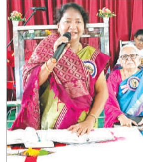
వరచంద్రలో గొప్ప ప్రాత్ర పోషించారని ఆమె