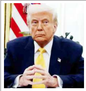
జరాన్ కొత్త సుప్రీం టీడర్ మొజ్జబా ఖమేని మరణించి ఉండేపున అమెరికా అధ్యక్షుడు డొనాల్డ్ ట్రంప్ సంవదన వ్యాఖ్యలు చేశారు. అమెరికా సైనిక దాడులు జరాన్ అర్ధ నాయకత్వాన్ని తుడిచిపెట్టాయని, దీంతో ఆ దేశంలో నాయకత్వం లేకుండా పోయిందని ట్రంప్ చెప్పుకొచ్చారు.

పశ్చిమాసియాలో యుద్ధజ్వాలలు ఆరేలా లేవు. పరస్పర దాడులతో మరలత ఉద్రిక్తంగా మారుతోంది. దీంతో ప్రపంచ దేశాలు ఏమి చేయలేని దుస్థితిలో ఉండిపోయాయి. అమెరికాను నిలువరించే పరిస్థితి ఏ దేశానికి లేకుండా పోయింది. సుంకాలు విధించినా చైనా, భారత్ లాంటి దేశాలు సైతం కిమ్మనకుండా మిన్నకుంటున్న దుస్థితి ఏర్పడింది. ఇప్పుడు చమురు సంక్షోభం నేపథ్యంలోనూ అమెరికాను కట్టడిచేయగల శక్తి ఎవరికి లేకుండా పోయింది. ట్రంప్ కూడా ఆయుధ బలంతో రెచ్చిపోతున్నాడు. ఇది ప్రపంచ వినాశానికి కంకణం కట్టుకున్న ఉపకాండ. ఇంతటితోనే ఇది ఆగుతుందనుకోవడానికి లేదు.