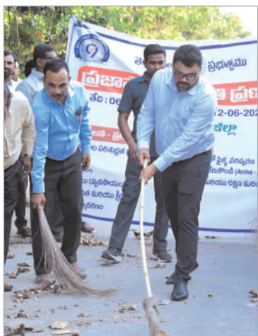
నేయాలని అధికారులకు ఆదేశించారు. ప్రజలకు సంబంధించిన ఫైళ్లు ఎక్కువకాలం పెండింగ్లో ఉండకుండా వెంటనే పరిష్కరించే విధంగా చర్యలు తీసుకోవాలని సూచించారు. మురికి నీరు నిల్వ ఉండే ప్రదేశాలను ముందుగానే గుర్తించి వాటిని శుభ్రం చేయాలని తెలిపారు. ఈ పది రోజుల ప్రత్యేక డ్రైవ్లో

నాగర్ కర్నూల్ మార్చి 6 (నినాదం) : 99 రోజుల ప్రజా పాలన ప్రగతి ప్రణాళికలో భాగంగా పరిశుభ్రత కార్యక్రమాలకు చీపిరి పట్టి క్రీకార్ చుట్టిన నాగర్ కర్నూల్ జిల్లా కలెక్టర్ బాదావత్ సంతోష్, 99 రోజుల ప్రజా పాలన ప్రగతి కార్యక్రమ ప్రణాళికలో భాగంగా చేపట్టిన మొదటి ధీమి "పరిశుభ్రత" కార్యక్రమాన్ని కలెక్టర్ లో కలెక్టర్ చీపిరి పట్టి ప్రారంభించారు. శుక్రవారం బడిపిని కార్యాలయ ఆవరణలో జిల్లా కలెక్టర్ బాదావత్ సంతోష్ సయంగా చీపిరి పట్టి అధికారులతో కలిసి పరిశుభ్రత కార్యక్రమాన్ని ప్రారంభించారు. ఈ సందర్భంగా జిల్లా కలెక్టర్ బాదావత్ సంతోష్ మాట్లాడుతూ, 99 రోజుల ప్రజా పాలన ప్రగతి ప్రణాళికలో భాగంగా నేటి నుండి మార్చి 15వ తేదీ వరకు ప్రత్యేక పరిశుభ్రత కార్యక్రమాలు నిర్వహించనున్నట్లు తెలిపారు. ఈ కార్యక్రమంలో ప్రభుత్వ అధికారులు, సిబ్బంది, ప్రజలు ఆందోళన పాల్గొని విజయవంతం చేయాలని పిలుపునిచ్చారు. ప్రతి ప్రభుత్వ కార్యాలయంలో పరిశుభ్రతకు అధిక ప్రాధాన్యత ఇవ్వాలని కలెక్టర్ సూచించారు. కార్యాలయ పరిసరాలు, గదులు, రికార్డు గదులు పరిశుభ్రంగా ఉంచాలని, అలాగే కార్యాలయంలో ఉన్న పెండింగ్ ఫైల్స్ను త్వరితగతిన క్లియర్ చేయాలని అధికారులకు ఆదేశించారు. ప్రజలకు సంబంధించిన ఫైళ్లు ఎక్కువకాలం పెండింగ్లో ఉండకుండా వెంటనే పరిష్కరించే విధంగా చర్యలు తీసుకోవాలని సూచించారు. మురికి నీరు నిల్వ ఉండే ప్రదేశాలను ముందుగానే గుర్తించి వాటిని శుభ్రం చేయాలని తెలిపారు. ఈ పది రోజుల ప్రత్యేక డ్రైవ్లో