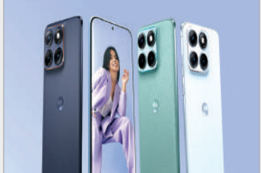
ఈ డిస్ ప్లే పనిచేస్తుంది. కార్టోగ్ గెర్లె గ్లాస్ 7వ ప్రాటెక్షన్ ఉంది. స్వామిద్రాగన్ 7వ జెన్ 4

ఎడ్జ్ సిరీస్ ఫోన్లతో ఇండియన్ స్మార్ట్ ఫోన్ మార్కెట్లో తనకంటూ ప్రత్యేక మార్కు సాధించిన మోటో రోలా.. ఎడ్జ్ 70 సిరీస్ లో కొత్త ఫోన్ ను లాంచ్ చేసింది. బీగ్ బ్యాటరీతో ఎడ్జ్ 70 ఫ్యూజన్ ను విడుదల చేసింది. రూ. 25 వేల బడ్జెట్లో పేరొందిన బ్రాండ్ లో మంచి స్మార్ట్ ఫోన్ కోసం చూస్తున్నవారు ఈ ఫోన్ ను పరిశీలించొచ్చు. ఇంతకీ ఈ ఫోన్ ఎలా ఉంది? అవెడేట్లు చూడండి?