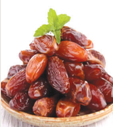
ఖర్జూరం: ఖర్జూరం మీ రోజువారీ ఆహారంలో

అరటిపండ్లు: ఫైబర్, విటమిన్లు, ఖనిజాలు, యాంటీ ఆక్సిడెంట్స్ అవసరమైనంత మేర ఉన్న అరటిపండ్లు మంచి శ్రేణిలో ఉన్నాయి. ఉదయాన్నే రెండు అరటి పండ్లు తినడం వల్ల మీరు రోజును అధిష్ట శక్తితో ప్రారంభించవచ్చు. ఐస్ క్రీమ్ తక్కువగా ఉన్నప్పుడు అరటిపండ్లలోని కార్బోహైడ్రేట్లు ఎనర్జీ బూస్టర్లుగా పనిచేస్తాయి. అదనంగా అరటిపండ్లలో ట్రిప్టోఫాన్ అనే అమినో ఆమ్లం ఉంటుంది. ఇది సెరోటోనిన్ ఉత్పత్తికి సహాయపడుతుంది. సెరోటోనిన్ మనల్ని రికాక్స్గా, సంతోషంగా ఉండేలా చేస్తుంది. కాబట్టి అల్పాహారానికి ముందు అరటి పండు తింటే మంచిదంటున్నారు నిపుణులు. అయితే గ్యాస్ట్రిక్ సమస్యలు ఉన్నవారు పరగడపున అరటి తినకపోవడమే మంచిది.