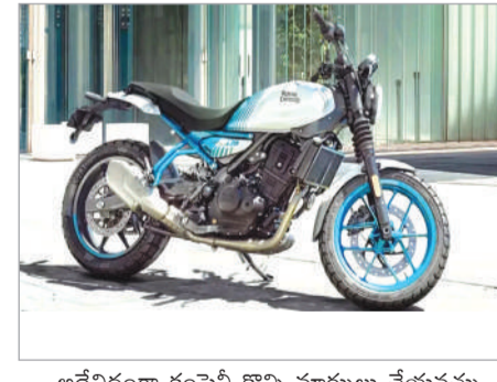
అదేవిధంగా కంపెనీ కొన్ని మార్పులు చేయవచ్చు.

ప్రస్తుతానికి రాయల్ ఎన్ఫీల్డ్ అవెడేట్ వివరాలు, రైడర్ అనుభవానికి తీసుకువచ్చే మార్పుల గురించి పెద్దగా వెల్లడించలేదు. బ్రాండ్ గత సమావేశం పరిశీలిస్తే, గేర్ బాక్స్ లో కొన్ని మార్పులు చేసే అవకాశం ఉంది. భారతదేశంలో హంటర్ 350 అవెడేట్ చేసిన వెర్షన్ కూడా ఇలాంటి మార్పు కనిపించింది. ఈ మార్పులు ప్రధానంగా రైడర్ సౌకర్యం, మోటార్ సైకిల్ నియంత్రణను మెరుగుపరచడం లక్ష్యంగా పెట్టుకున్నాయి.