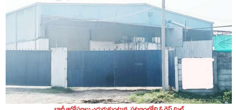
భారీ ఆరోగ్యశాల ఎదురుకుంటున్న పట్టణంలోని ఓ రైస్ మిల్

కాగజ్ నగర్, మార్చి 7 (నినాదం): కొత్తగా వేలానుకున్న సీఎంఆర్ స్కామ్ పై రాష్ట్ర ముఖ్యమంత్రి రేవంత్ రెడ్డి అంత నీలయస్ గా చెప్పినా కొందరు లక్షమార్కులు మాత్రం తమ దండాను ఆపడంలేదు. కొమురం భీష్మ ఆసిఫాబాద్ జిల్లా కాగజ్ నగర్ లో శనివారం పట్టుబడ్డ ఓ ఆటోనే దీనికి సాక్ష్యంగా నిలిచింది. 'కాగజ్ నగర్ మిల్లర్.. రెడ్డిని సగ్గర్' అనే శీర్షికతో నినాదం దినపత్రికలో శనివారం ఓ ప్రత్యేక కథనం ప్రచురితమైంది. దీనిపై స్పందించిన జిల్లా స్పెషల్ ట్రాంప్ పోలీసులు కాగజ్ నగర్ పట్టణ శివారులో అక్రమంగా పీడీఎస్ బియ్యన్ని తరలిస్తున్న ఓ ఆటోను పట్టుకున్నారు. అంతరంగ స్థానిక పోలీసులకు అప్పగించారు వారు బాధ్యులై పై కేసు నమోదు చేసారు.