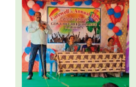
మధిర ప్రభుత్వ డిగ్రీ కళాశాలలో ఘనంగా ఫేర్వెల్ డే వేడుకలు