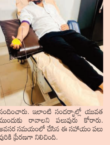
సందించారు. ఇలాంటి సందర్భాల్లో యువత ముందుకు రావాలని పలువురు కోరారు. అవసర సమయంలో చేసిన ఈ సహాయం పలు వురికి ప్రేరణగా నిలిచింది.