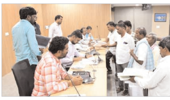
వచ్చిన, పెండింగ్ లో ఉన్న అర్జీలను సైతం వారంలో పరిష్కరించాలని అన్ని శాఖల అధికారులను ఆదేశించారు. ఈ కార్యక్రమంలో అన్ని శాఖల జిల్లా అధికారులు, తదితరులు పాల్గొన్నారు.