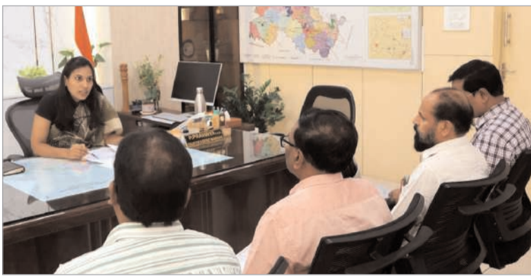
అనుగుణంగా పురోగతి సాధించాలని, రైతులను యాంత్రీకరణ వైపు మరింతగా ప్రోత్సహించాలని సూచించారు. ఉద్యానవన యాంత్రీకరణ పథకం ద్వారా మినీ ట్రాక్టర్లు, పవర్ వీడర్లు, పవర్ టీల్లర్లు, బ్రష్ కట్టర్లు, పవర్ స్ప్రయర్లు వంటి యంత్రాల

సంగారెడ్డి జిల్లాలో, మార్చి 23 (నినాదం): జిల్లాలో రైతుల ఆదాయం పెంపు, వ్యవసాయ ఉత్పాదకతలో గణనీయమైన వృద్ధి సాధించేందుకు ఫార్మ్ మెకనైజేషన్, వర్షాధార ప్రాంతాల అభివృద్ధి (చాబా), తేనెటీగల పెంపకం పథకాలను సమర్థవంతంగా అమలు చేయాలని జిల్లా కలెక్టర్ ప్రావీణ్య సంబంధిత అధికారులను ఆదేశించారు. సోమవారం కలెక్టర్ ఛాంబర్లో వ్యవసాయ, ఉద్యానవన, డీఆర్డీఏ శాఖల అధికారులతో జిల్లాలో అమలువుతున్న ఫార్మ్ మెకనైజేషన్, వర్షాధార ప్రాంతాల అభివృద్ధి, తేనెటీగల పెంపకం కార్యక్రమాల పురోగతిపై జిల్లా కలెక్టర్ సమీక్ష నిర్వహించారు. ఈ సందర్భంగా కలెక్టర్ మాట్లాడుతూ, ప్రస్తుత ఆర్థిక సంవత్సరానికి కేటాయించిన ఫార్మ్ మెకనైజేషన్ లక్ష్యాలను తేగంగా సాధించాలని అధికారులకు సూచించారు. ఇప్పటివరకు సాధించిన పురోగతిని పరిశీలించి, యుటిలైజేషన్ సర్టిఫికేట్లు (ఐజిఐ) వెంటనే సమర్పించాలని ఆదేశించారు. ప్రభుత్వం నిర్దేశించిన లక్ష్యాలకు