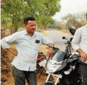
ఖమ్మం, మార్చి 23 (నినాదం):

మతిస్థిమితం లేని వ్యక్తిని అన్నం సేవ ఫౌండేషన్ కు తరలింపు. సోమవారం ఖమ్మం నియోజకవర్గ పరిధిలోని వి వెంకటా రుంపారెం వందనం రోడ్ లో 35 సంవత్సరాల వయసుగల మతిస్థిమితం లేని వ్యక్తి సంవత్సరం ప్రజల ఇచ్చిన సహకారం మేరకు ఖమ్మం సగరానికి చెందిన అన్నం ఫౌండేషన్ స్పందించి వెంటనే సరకు వ్యక్తి సంవత్సరం ప్రాంతానికి వెళ్లి మతిస్థిమితం లేని వ్యక్తిని విచారించగా ఏపీ చెప్పలేని