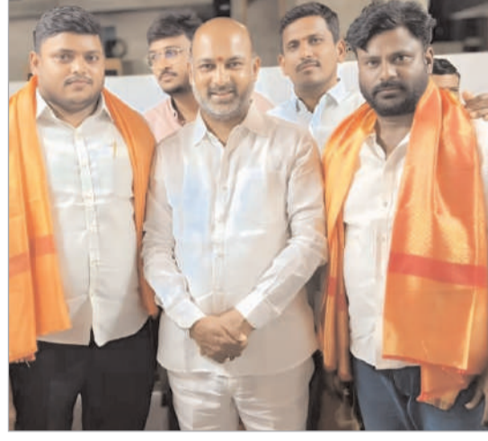
పాఠశాల పలువురు గ్రామస్థులు తదితరులు పాల్గొన్నారు.