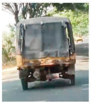
మంగళవారం మధ్యాహ్నం పీడిఎస్ రైస్ తో ఓ మిల్లుకు వెళ్తున్న ఆటో

ముఖ్యమంత్రి స్థాయిలో సీనియర్ గా తీసుకున్న టాస్కును జిల్లా స్థాయి డిస్ట్రిబ్యూషన్ కమిటీకి లైట్ తీసుకోగలరా, కింది సుండి రాష్ట్ర కేంద్రం వరకు గల సంబంధిత శాఖల అధికారుల సైతం అదేకోటిలో చేరగలరా అంటే, కొమురం భీమ ఆసిఫాబద్ జిల్లా కాగజ్ నగర్ నుండి అవుననే సమాధానం వస్తోంది. మీడియా కథనాల నేపథ్యంలో ఇచ్చిన కలెక్టర్ ఆదేశాలను సైతం ఇక్కడి కొందరు మిల్లర్లు బేఖాతరు చేసారు. పైగా తమవైపు వైబిఎస్ కు నాన్ స్టాబ్ దారులు వేసుకున్నారు. ఇందుకు గాను రూ. 2 కోట్లు వందారు. తద్వారా మూడు నెలల కోటా పీడిఎస్ బియ్యాన్ని కొల్లగొట్టేందుకు రెడీ అయ్యారు. ఇంతటి రసవత్త కథను నడిపిస్తున్న ఇక్కడి కొందరు మిల్లర్ల బాగోతున్న నినాదం ప్రత్యేక కథనం.