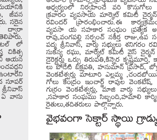
అర్జీనీని ప్రభుత్వం విలీనం చేసినా ఉద్యమం కొనసాగుతుంది అనే కాల్పనిక భయం ఉన్నందున, శుక్రవారం కోడూర్ డి.పి. ఊరిలో కార్యకర్తల కలిసి ధర్నా నిర్వహించారు...