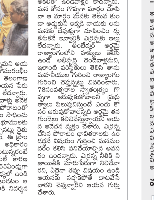
అర్జీనీని కాల్చుకులు ఆత్మహత్యలకు పాల్పడవద్దు. అలాగే రైతులకు పెట్టుబడి సహాయంతో పాలు రైతులకు రుణమాఫీ అందించిన ఘనత కాంగ్రెస్ ప్రభుత్వానిదేనని ఆమె అన్నారు.