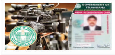
రాష్ట్రంలో జర్నలిస్టులకు సంబంధించి అక్రిడిటేషన్ల జారీ ప్రక్రియ పూర్తి నిబంధనలకు విరుద్ధంగా జరుగుతోందని పర్సన్ల అండ్ ఇండియా రాష్ట్ర ఉపాధ్యక్షుడు తాదూరు కరుణాకర్ ఒక ప్రకటనలో ఆరోపించారు.

శనివారం, ఏప్రిల్ 25, 2026 సంపుటి - 22 సంచిక 207 వెల - 7 పేజీలు - 12 - 8