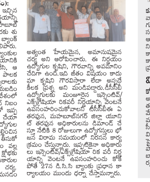
అమరవంక, ఏప్రిల్ 24, (నివాడం): డి.సి.సి. బ్యాంకు ఉద్యోగులకు ఇచ్చిన ఇన్సెంటివ్ ఎక్స్ గ్రేషియా లికవర్ నిర్ణయాన్ని వ్యతిరేకిస్తూ డి.సి.సి. ఉప మాజీ డి.ఎం. నగర్ జిల్లా యూనిట్ నిలుపు వేరక శుక్రవారం ఆత్మకూరు డి.సి.సి. బ్యాంకు ముందు ఉద్యోగులు నిరసన తెలిపారు.

అమరవంక, ఏప్రిల్ 24, (నివాడం): డి.సి.సి. బ్యాంకు ఉద్యోగులకు ఇచ్చిన ఇన్సెంటివ్ ఎక్స్ గ్రేషియా లికవర్ నిర్ణయాన్ని వ్యతిరేకిస్తూ డి.సి.సి. ఉప మాజీ డి.ఎం. నగర్ జిల్లా యూనిట్ నిలుపు వేరక శుక్రవారం ఆత్మకూరు డి.సి.సి. బ్యాంకు ముందు ఉద్యోగులు నిరసన తెలిపారు. ఈ సందర్భంగా ఏ.ఎం.ఎస్.ఎస్. సభ్యులు ప్రభుత్వంపై విమర్శలు వ్యక్తం చేశారు. ఎన్.ఆర్.ఎం.ఎస్.ఎస్. సభ్యులు ప్రభుత్వంపై విమర్శలు వ్యక్తం చేశారు. ఎన్.ఆర్.ఎం.ఎస్.ఎస్. సభ్యులు ప్రభుత్వంపై విమర్శలు వ్యక్తం చేశారు.