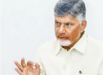
ఇవ్వాలని సీఎం అధికారులను ఆదేశించారు.