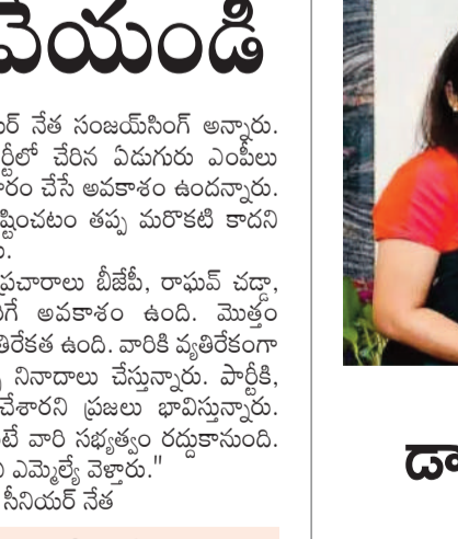
హైదరాబాద్, ఏప్రిల్ 26 (నినాదం)