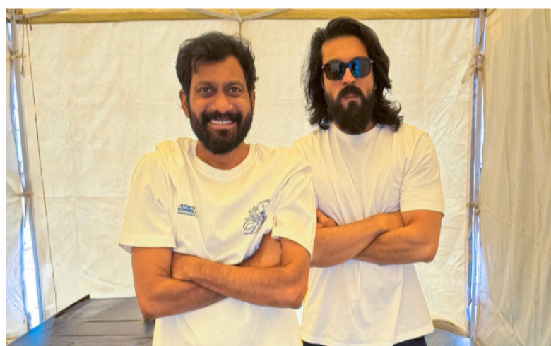
కున్న బుచ్చిబాబు కాంటినెంట్ లో వస్తున్న మీడియాలో ట్రెండ్ అవుతుండగా.. ఈ సినిమాపై ఇండస్ట్రీలోనూ, అభిమానుల్లోనూ అంచనాలు తారాస్థాయిలో ఉన్నాయి. ప్రస్తుతం ఈ ఫోటోలు సోషల్

ఈ సినిమాకు సంబంధించి దర్శకుడు బుచ్చిబాబు సోషల్ మీడియాలో చేసిన ఓ పోస్ట్ అభిమానుల్లో ఉత్సాహాన్ని నింపు తోంది. రామ్ చరణ్ తో కలిసి ఉన్న కొన్ని ఫోటోలను ఆయన పంచుకున్నారు. ఈ ఫోటోలలో రామ్ చరణ్, బుచ్చిబాబు ఎంతో ఉత్సాహంగా, నవ్వుతూ కనిపించారు. ఈ ఫోటోలకు "తుపానుకు ముందు ప్రశాంతత" అని క్యాప్షన్ జోడించడం ఆసక్తిని రేకెత్తిస్తోంది. అంతేకాకుండా, "నాకు ఇష్టమైన పోజులో నా ఫేవరెట్ సర్.. లవ్ యూ సర్" అంటూ రామ్ చరణ్ పై బుచ్చిబాబు తన అభిమానాన్ని చాటుకున్నారు. ప్రస్తుతం 'పెద్ద' షూటింగ్ చివరి దశలో ఉంది. ఈ సినిమాను జాన్ లో విడుదల చేసేందుకు సన్నాహాలు చేస్తున్నారు. 'ఆర్ఆర్ఆర్'తో ప్రపంచవ్యాప్త గుర్తింపు పొందిన రామ్ చరణ్, తొలి సినిమా 'ఉప్పెన్' తోనే బ్లాక్ బస్టర్ అందు