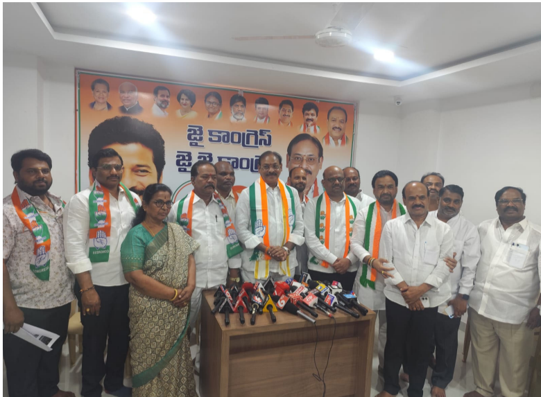
10 సంవత్సరాల ని హాయంలో కూకట్ పల్లి కి నువ్వు చేసింది శూన్యం... 90 శాతం అభివృద్ధి చేశా మనదం హాస్యాస్పదం చిరు వ్యాపారులపై కపట ప్రేమ ఎందుకు... మా తాండ్రిని కావ్యకర్తల జోలికొస్తే ఖబడ్డార్ ఎమ్మెల్యే కృష్ణా రావు పై బండి రమేష్ షేర్...

కూకట్ పల్లి లో 90% అభివృద్ధి అని చెప్పిన నీవు చేసిన చెప్పుకోదగ్గ ఒక్క ప్రాజెక్టు కూకట్ పల్లి లో చూపించు... కూకట్ పల్లి కాంగ్రెస్ కార్యాలయం ఏర్పాటు చేసిన పుత్తికా విలేజ్ కు సమావేశంలో కూకట్ పల్లి ఎమ్మెల్యే మాధవరం కృష్ణారావు పై నియోజకవర్గ కాంగ్రెస్ పార్టీ ఇంచార్జ్ బండి రమేష్ షేర్ ఆయ్యారు. ప్రధానంగా ఇటీవల ప్రజా పాలన ప్రగతి నివేదిక విషయంలో రోడ్లపై ఉన్న ఆక్రమణలను తొలగించడం విమర్శించారు బండి రమేష్ మాట్లాడుతూ కూకట్ పల్లి లోని చిరు వ్యాపారులపై కపట ప్రేమ చూపిస్తున్న నువ్వు మీ హయాంలో చిరువ్యాపారులు ఎందుకు పట్టించుకోలేదని బండియల్ లేకు వద్ద ఉన్న 40 మంది చిరు వ్యాపారుల మీ హయాంలో ఎందుకు లేవేసారని ప్రశ్నించారు. మీ హయాంలో వారికి పది ఎకరాలు ఇప్పించి