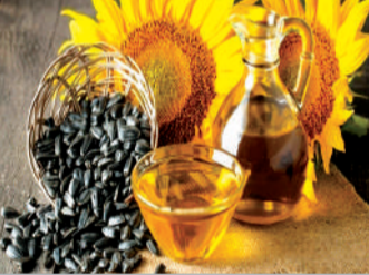
ఉంది. మనదేశానికి రష్యా, ఉక్రెయిన్, అరెంజైనా నుంచి ఈ నూనె ఎక్కువగా దిగివేయబడి అవుతోంది.

ముంబయి: పశ్చిమానీయా ఉద్రిక్తతల పరిణామాల ఫలితంగా మన దేశంలో శుద్ధి చేసిన (రిఫైన్డ్) పొద్దుతిరుగుడు పువ్వు (సన్ ఫ్లవర్) నూనె విక్రయాల పరిమాణం ఈ ఆర్థిక సంవత్సరం (2026-27)లో 10% తగ్గి అవకాశం ఉందని క్రిసిల్ రేటింగ్స్ అంచనా వేసింది. సరఫరా అంతరాయాలకు తోడు, పెరుగుతున్న ధరల నేపథ్యంలో, వాత్రేన ప్రత్యామ్నాయ నూనెల వైపు వినియోగదారు మారుతుండటంతో, గిరాకీ తగ్గి విక్రయాల పరిమాణం తగ్గుతుందని పేర్కొంది. సంస్థ నివేదిక ప్రకారం..