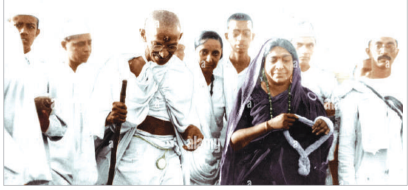
ముగస్తుందని పత్రికలు పేర్కొన్నాయి.

కొమ్మిది దశాబ్దాల క్రితం 1930 ఏప్రిల్ 6 న మహాత్మా గాంధీ దండిలో ఉప్పు చట్టాలను ఉల్లంఘించి, వెలాది మందిలో నిరసన తెలిపి, లక్షలాది మందిని చెరసల్ల పరిచిన సంఘటన. ఉప్పు పన్నును ధిక్కరిస్తూ మహాత్మా గాంధీ, 1930 మార్చి 12 నుండి 1930 ఏప్రిల్ 6 వరకు, 384 కిలోమీటర్ల దూరం, వెలమంది సత్యాగ్రహాలతో కలిసి పాదయాత్ర చేసి గుజరాత్ లోని దండి వద్ద ఉప్పు తయారు చేసి సూర్యాన్ని కల్పించిన మరచి పోలేని సేవధ్యం.