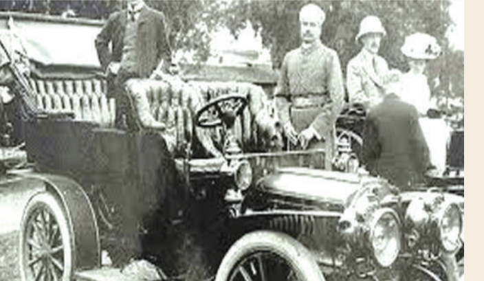
మీర్ ఉస్మాన్ ఆలీ ఖాన్ 1967 ఫిబ్రవరి 24 న కింగ్ కోల్ ప్యాల్సెస్ మరణించాడు.

ప్రాంతంలో ఉన్న ప్రభుత్వ భవనం ఈ రాజ్ బాగ్స్. ఇది రాష్ట్ర గవర్నరు అధికారిక నివాసంగా ఉపయోగ పడుతుంది. ఆజా ఖానా ఎ జెఫ్రో... మూసీ నది తీరంలో ఆజా ఖానా ఎ జెఫ్రో అనే ప్రార్థన మందిరం ఉంది. నిజాం సాగర్, ఉస్మాన్ సాగర్, హిమాయత్ సాగర్ సిర్పించారు. ఉస్మానియా విశ్వవిద్యాలయం 1918 వ సంవత్సరంలో స్థాపించబడింది. ఇది భారతదేశంలో అతిపెద్ద విశ్వవిద్యాలయాలలో ఒకటిగా, ప్రాథమిక విద్య తప్పనిసరి చేసింది, పెదలకు ఉచితంగా విద్య అందించారు. నిర్మారు పెదరు మిల్స్, బోధన్ చక్కెర ఫ్యాక్టరీ, అజంజాహీ నూలు మిల్లులు, చార్మినార్ సిగరెట్ ఫ్యాక్టరీ మొదలైన కర్మాగారాలు నెలకొల్పి బడిపింది. నిజాం స్టేట్ లైట్స్ నెలకొల్పి బడిపింది. 1965 లో, నిజాం భారత చైవా యుద్ధం 1962 సమయంలో 5000