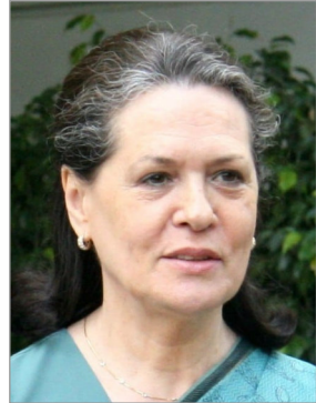
మోదీ నాయకత్వంలోని కేంద్రం కు గణనను

మహిళా రిజర్వేషన్ సమస్య కాదు, నియోజకవర్గాల పునర్విభజన అసలైన సమస్య అని కేంద్రపై సోనియా గాంధీ విమర్శలు చేశారు. ఒక పత్రిక వ్యాసం లో నియోజకవర్గాల పునర్విభజన ప్రతిపాదనను ఆమె అత్యంత ప్రమాదకరమైనది అని రాజ్యాంగంపై దాడి అని అభివర్ణించారు. అంతేకాకుండా ప్రధానమంత్రి నరేంద్ర మోదీ నాయకత్వంలోని కేంద్రం కు గణనను