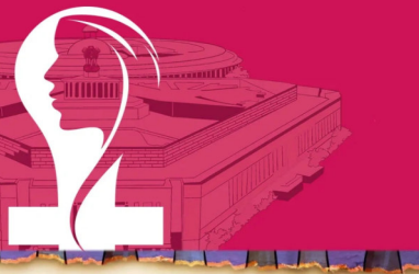
Women's Reservation Bill