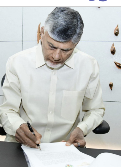
అమరావతి, ఏప్రిల్ 14 (నినాదం): చట్టసభల్లో మహిళలకు 33 శాతం రిజర్వేషన్లు కల్పించేందుకు ఉద్దేశించిన 'సారి శక్తి' చంద్రశేఖర అధినాయకం

- ఏపీలోని అన్ని పార్టీలకు సీఎం చంద్రబాబు లేఖ