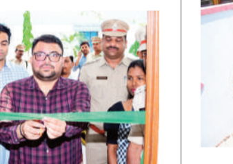
దాలను గణనీయంగా తగ్గించవచ్చని, డ్రైవింగ్ సమయంలో మొబైల్ ఫోన్ వినియోగాన్ని పూర్తిగా నివారించాలని అవసరమైన వారు జిల్లా కలెక్టర్ గుర్తు చేశారు.