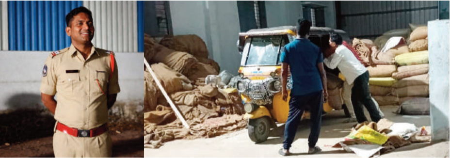
కొండ్ల రోజుల క్రితం పోలీసులు ఓ రైస్ మిల్లల్లో రేషన్ బియ్యం పట్టుకున్న చిత్రం