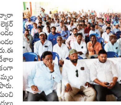
విద్యుత్ సౌకర్యం లేని ప్రాంతాలను ప్రాధాన్యత క్రమంలో గుర్తించి పరిష్కరించాలని అధికారులకు ఆదేశాలు...