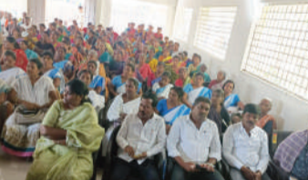
మంజూరు చేసిన నిధులను సైతం గ్రామ సభలో చదివి వినిపించారు. ఆయా గ్రామాల సర్పంచులు గ్రామసభలో గ్రామాలలో గల సమస్యలను, చేపట్టే అభివృద్ధి సంక్షేమ పథకాలను, ప్రజా పాలన - ప్రభుత్వ ప్రణాళిక లో భాగంగా పలు అభివృద్ధి పనులకు ప్రభుత్వం మంజూరు చేసిన నిధులను సైతం గ్రామ సభలో చదివి వినిపించారు.