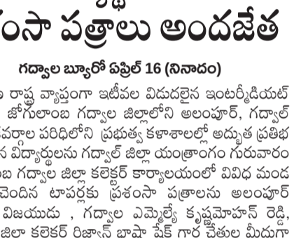
విద్యార్థులకు ప్రశంసా పత్రాలు అందజేత...

తెలంగాణ రాష్ట్ర వ్యాప్తంగా జరిపే విడుదలైన ఇంటర్మీడియట్ ఫలితాల్లో జిగ్గెలం గద్దాల జిల్లాలోని అలంపూర్, గద్దాల నియోజకవర్గాల పరిధిలోని ప్రభుత్వ కళాశాలల్లో అత్యుత్తమ ఫలితం సాధించిన విద్యార్థులను గద్దాల జిల్లా యంత్రాంగం గురువారం జిగ్గెలం గద్దాల జిల్లా కలెక్టర్ కార్యాలయంలో వివిధ మండలాలకు చెందిన లాస్పర్లకు ప్రశంసా పత్రాలు అందజేత చేసింది.