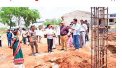
చేస్తున్నట్లు వివరించారు. పాఠశాల భవనం నిర్మాణం వేగవంతంగా కొనసాగుతున్నట్లు, డిజైన్ తప్పకుండా నాణ్యత ఎలాంటి లోపం కాకుండా ప్రత్యేక శ్రద్ధ వహించాలని కలెక్టర్ సూచించారు.

పంగూరు మండల కేంద్రంలో నిర్మాణంలో ఉన్న తెలంగాణ మోడల్ స్కూల్ పనులను జిల్లా కలెక్టర్ బాదవత్ సంతోష్ ప్రత్యక్షంగా పరిశీలించారు. ఈ సందర్భంగా నిర్మాణ సలహా సందర్భించి పనుల పురోగతిపై సంబంధిత అధికారులతో సమగ్రంగా చర్చించారు.