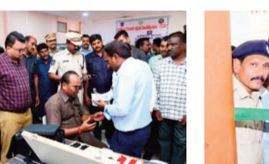
అత్యంత ముఖ్యమని, ముఖ్యంగా వాహనదారులు ప్రతి 6 నెలలకు ఒకసారి కంటి పరీక్షలు చేయించుకోవాలని సూచించారు. అవసరమైన వారు కచ్చితంగా కళ్లజాబ్ చేయించుకోవాలని, ఆరోగ్యంపై శ్రద్ధ పెట్టాలని కోరారు.

గురువారం నాగర్ కర్నూల్ పోలీస్ పరేడ్ మైదానంలో 99 రోజుల ప్రజాపాలన - ప్రగతి ప్రణాళిక నేపథ్యంలో రోడ్డు ప్రమాదాల నివారణ లక్ష్యంగా నిర్వహిస్తున్న ఆర్డెస్ - అల్లెవీ కార్యక్రమంలో భాగంగా జిల్లా పోలీస్ శాఖ, వైద్య ఆరోగ్యశాఖ సంయుక్తంగా నిర్వహించారు.