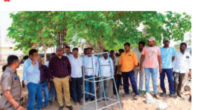
లిని కలెక్టర్ ఇంజనీరింగ్ అధికారులకు స్పష్టం చేశారు. ఎక్కడైనా అలసత్వం గమనించినట్లుంటే తక్షణమే పరిష్కార చర్యలు చేపట్టాలని, పనుల పురోగతిపై నిరంతరం పర్యవేక్షణ కొనసాగించాలని, ఇతర పాఠశాల నిర్మాణం పూర్తయిన తర్వాత ఈ ప్రాంత విద్యార్థులకు మెరుగైన విద్యా సౌకర్యం లభిస్తుందని, ప్రభుత్వ విద్యా ప్రమాణాలు మరల పెరుగుతాయని కలెక్టర్ ఆశాభావం వ్యక్తం చేశారు.