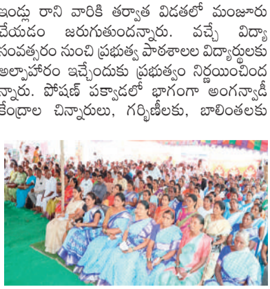
ప్రజా పాలన ప్రగతి ప్రణాళికతో ప్రజలకు అవగాహన...