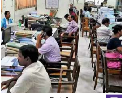
హైదరాబాద్, ఏప్రిల్ 1 (నినాదం):

తెలంగాణ రాష్ట్రంలోని వేలాది మంది కాంట్రాక్ట్ అవుట్సోర్సింగ్ ఉద్యోగులకు రాష్ట్ర ప్రభుత్వం ఒక తీపి కబురు అందించింది. గత కొన్నిన్నాగా వేతనాల చెల్లింపులో ఎదురవుతున్న తీవ్ర జాప్యం, మధ్యస్థుల అక్రమాలకు అడ్డుకట్ట వేస్తూ ప్రభుత్వం కీలక నిర్ణయం తీసుకుంది. ఇకపై ఏప్రిల్ నెల నుంచి ఈ ఉద్యోగులందరికీ నేరుగా వారి బ్యాంక్ ఖాతాల్లోనే జీతాలు జమ చేయాలని స్పష్టమైన ఆదేశాలు జారీ చేసింది.