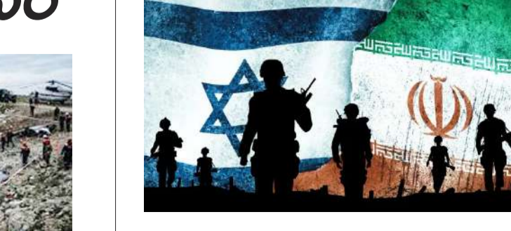
మాస్కో, ఏప్రిల్ 1 (నినాదం):

అమెరికా ఇజ్రాయేల్తో కొనసాగుతోన్న యుద్ధాన్ని ముగించేందుకు తాము సిద్ధంగా ఉన్నామని ఇరాన్ అధ్యక్షుడు పెజ్కేషియాని పేర్కొన్నారు. అయితే, తమకు కొన్ని బలమైన హామీలు ఇవ్వాలన్న అవసరం ఉందన్నారు. యూరోపియన్ కౌన్సిల్ అధ్యక్షుడు ఆంటోనియో కోస్టాతో ఆయన ఫోన్లో మాట్లాడారు. ఈ సందర్భంగా ఆయన ఈ వ్యాఖ్యలు చేశారని ఇరాన్ అధ్యక్ష కార్యాలయం ఓ ప్రకటనలో తెలిపింది. యుద్ధం ముగించాలంటే తాము విధించిన షరతులకు అంగీకరించాలని ఇరాన్ అధ్యక్షుడు పేర్కొన్నారు. ముఖ్యంగా భవిష్యత్తులో ఇలాంటి దాడులు పునరావృతం కావనీ బలమైన హామీ ఇవ్వాలన్నాడు. అప్పుడు ఈ యుద్ధం ముగించేందుకు తాము సిద్ధంగా ఉన్నట్లు వెల్లడించారు.