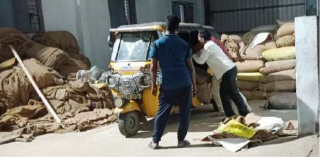
కాగజ్ నగర్, ఏప్రిల్ 01 (నినాదం):

కాగజ్ నగర్ కు చెందిన ఓ రైస్ మిల్లు బాగోతంబయటపడింది. అది రైస్ మిల్లు ముసుగులో నడుస్తున్న పక్కా రేషన్ మిల్లు తేలింది. కొమరం భీమ్ ఆసిఫాబాద్ జిల్లా కాగజ్ నగర్ లోని ఓ 06 మిల్లులు రేషన్ బియ్యం లక్షమ రవాణాకు పాల్యదు తున్నాయని 'నినాదం' దినపత్రిక గత కొద్దిరోజులుగా వరుస కథనాలు ప్రచురించింది. లక్షలాలా అన్నీ నిజమేనని తేలింది.