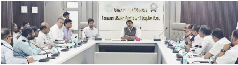
హైదరాబాద్, ఏప్రిల్ 1 (నినాదం):

ప్రైవేట్ కంపెనీలకు సివిల్ సప్లైస్ కమిషన్ హెచ్చరిక