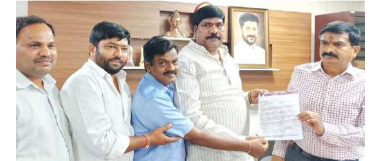
హైదరాబాద్, ఏప్రిల్ 27 (నినాదం):