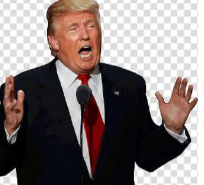
ఇరాన్ పూర్తిగా ఒప్పందాన్ని అమలు చేసే వరకు అమెరికా సైనిక బలగాలు అక్కడే కొనసాగుతాయని తెలిపారు. తమ దేశానికి చెందిన యుద్ధ నౌకలు, విమానాలు, సైనికులు, ఆయుధాలు మొదలైనవి ఇరాన్ వలసర ప్రాంతాల్లోనే ఉంటాయని ట్రంప్ పేర్కొన్నారు.

40 రోజుల పాటు కొనసాగిన యుద్ధానికి తెర దించుతూ అమెరికా, ఇరాన్ దేశాలు రెండు వారాల కాల్పుల విరమణ ఒప్పందం చేసుకున్న సంగతి తెలిసిందే. పాకిస్తాన్ మధ్యవర్తిత్వంతో రెండు దేశాల మధ్య రాజీ కుదిరింది. రెండు దేశాల మధ్య రాజీ కుదుర్చుటాన్ని పాకిస్తాన్ గొప్పగా ప్రచారం చేసుకుంటోంది. తనను తాను శాంతిదూతగా చెప్పుకుంటోంది. ఇలాంటి సమయంలో టిలినకు చెందిన డి పైసానియల్ టైమ్స్ న్యూస్ పేపర్ సంచలన కథ నాన్నీ ప్రచురించింది. ఆ కథనం ప్రకారం.. అమెరికా ఒత్తిడి కారణంగానే పాకిస్తాన్ మధ్యవర్తిత్వం చేయడానికి ముందుకు వచ్చింది.