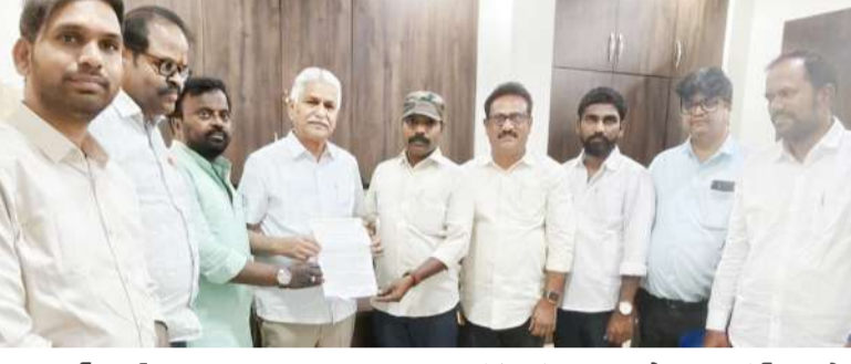
హైదరాబాద్, ఏప్రిల్ 9 (నినాదం):