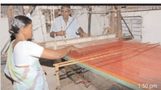
పొందుతున్నాయని వివరించారు. అయితే ప్రస్తుతం ప్రభుత్వం తీసుకున్న నిర్ణయంతో ఆ సంప్రదాయ వ్యవస్థ దెబ్బతింటుందని విమర్శించారు.