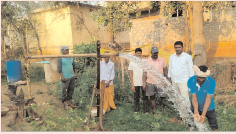
మోటారు ఏర్పాటు చేయడం ద్వారా భవిష్యత్లో ఇబ్బందులు తలెత్తకుండా చర్యలు తీసుకున్నట్లు ఆమె తెలిపారు. ఈ సందర్భంగా సర్పంచ్ మాట్లాడుతూ, నీరు జీవనాధారం