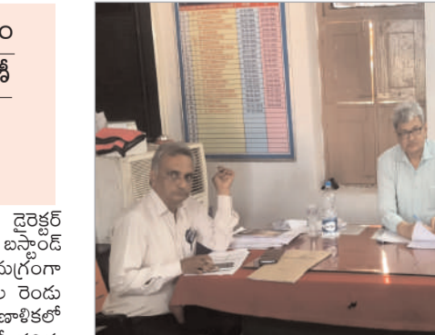
మెరుగైన సేవలు అందించేందుకు అవసరమైన మార్పులు చేపట్టాలని సూచించారు. కోదాడలో నూతన బస్టాండ్ నిర్మాణానికి సంబంధించిన నాగశ్రీతో పాటు ఆర్డీసీ సిబ్బంది పాల్గొన్నారు.

త్యరలో నూతన బస్టాండ్ నిర్మాణ పనులు ప్రారంభం మహాలక్ష్మి పథకంలో భాగంగా స్టార్ట్ కార్డుల పంపిణీ గ్రామాలకు కొత్త బస్సు సౌకర్యాలు హామీ ఎగ్జిక్యూటివ్ డైరెక్టర్ ఖమ్మూ షాఖాన్