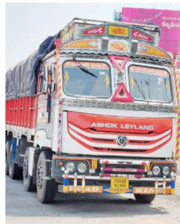
హైదరాబాద్ బ్యారో, మే 1 (నినాదం):

రాష్ట్రంలోని కొన్ని జిల్లాల్లో గల సివిల్ సప్లైస్ శాఖ బాధ్యుల తీరు తీవ్ర విమర్శలకు గురివుతోంది. లక్షమ రకాణాను నియంత్రించకపోతే నేర బియ్యం సరఫరాకు నేరుగా సహకరిస్తున్నారనే ఆరోపణలు గుప్పిస్తుంటున్నాయి. నిరుపేదలకోసం రూపొందించిన పథకం పక్కదారి పట్టడంపై ప్రభుత్వ లక్ష్యం వీలమూలంగా నీరుగారుతుంది. ప్రభుత్వం, ఉన్నతాధికారుల అజాబ మారదర్శకాలున్నా పట్టుబట్ట నేరస్థుల విషయంలో కాలం చెల్లిన చర్యలే అవలంబిస్తున్నారని చట్టాల్లోని లొసుగులే కీలకంగా సాగుతున్న వీల కళాప్రావీణ్యత సగృహ్యం వైర్యాన్ని నింపుతోంది. ఎన్నో సార్లు పట్టుబట్టా ఏమీ కాదనే భీమాతోనే వారు ఆగటం లేదనే అభిప్రాయాలు వ్యక్తమవుతున్నాయి. సిద్దిపేట జిల్లా కేంద్రంలో మూడు రోజులుగా సాగుతున్న ఓ తంజో పై ప్రభావనకు అడ్డం పడుతోంది. విషయం తెలిసిన ప్రతిపక్షిని విన్నయారికి గురిచేస్తోంది.