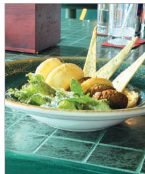
హైదరాబాద్ బ్యూరో, (నినాదం): నినాదం నగరంలో కొత్తగా హాటెక్ సీటీలో ప్రారంభమైన 'డాండ్ అండ్ డాండ్' డైనింగ్ సెట్ లైఫ్ అనుభవాలను ఒక వేదికపై సమస్యను చేస్తూ ప్రత్యేకతను చాటుతోంది.

పగటిపూట ప్రశాంత భోజనాలు, సంభాషణలకు అనువుగా ఉండే ఈ ప్రదేశం, సాయంత్రం సువి ఉత్సాహభరితమైన బార్ వాతావరణంగా మారుతుంది. అంతరాత్మీయ శైలిలో రూపొందించిన మెనూ, సమయానుసారంగా, నవతరాలైన, సంగీతం ఈ ప్రదేశానికి ప్రధాన ఆకర్షణలుగా నిలువనుంది. ఆధునిక డిజైన్లతో రూపొందించిన, పని నుంచి విశ్రాంతికి సహజ మార్పు కలిగించేలా ఈ కాన్సెప్ట్ రూపొందించామని నిర్వాహకులు కోశిక