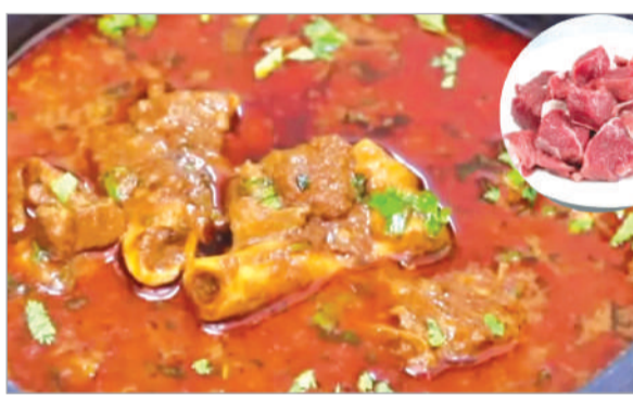
చికెన్ ధర రూ.360 వలకుతోంది.

జయశంకర్ భూపాలపల్లి బ్యూరో, (నినాదం): ఏం కొనేటట్లు లేదు...ఏం తినేటట్లు లేదు నాగులో నాగన్నా..అన్నట్లుగా ఈనాడు మాంసం ప్రియుల పరిస్థితి నెలకొంది. తెలంగాణలో చుక్క..ముక్క లేనిదే ఓ కార్పం జరుగుతుంది...చుక్క కార్పమైనా అచుక్క కార్పమైనా నీసు అనేది ఉంటుంది. ఒకప్పుడు ఇంటికి చుట్టూ వస్తే మాత్రమే నీసు కూరలు వండే వారు..కానీ రానురాను ముక్క లేనిదే ముద్ద దిగడనే పరిస్థితికి చేరుతున్నారు. ఈ క్రమంలో చికెన్ మటన్ ధరలు అమాంతం పెరిగిపోవడంతో మాంసం ప్రియులు బోరుమంటున్నారు. ముక్క లేకుండా ఎట్లా తినుడు మావా అంటూ గ్రామాల్లో చర్చించుకుంటున్న సందర్భాలు కనిపించడం విశేషం.