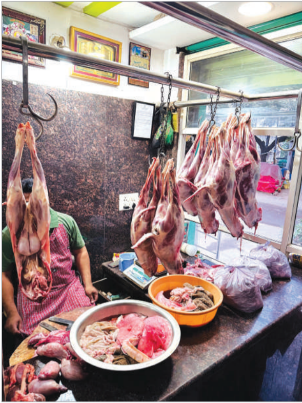
భారీగా పెరిగిన చికెన్, మటన్ ధరలు..

మస్తుగా పెరిగిన మటన్...చికెన్ రెట్లు మాంసం ప్రియులకు భారీ షాక్ ఎండ తీవ్రతే కారణమంటున్న వ్యాపారులు