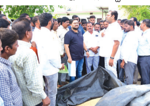
నాగర్ కర్నూల్ మే 14 (నినాదం) : నాగర్ కర్నూల్ జిల్లా ఉరుకొండ మండల రాజాలపల్లి గ్రామ పర్లటలో భాగంగా జిల్లా కలెక్టర్ హేమంత్ కేశవ్ పాటిల్, జడ్పర్ల ఎమ్మెల్యే అనిరుద్ రెడ్డి గ్రామంలో పరి ధాన్యాన్ని అరబితులను రైతు పద్ధతి వెళ్లి పలు దిగుబడి, ధాన్యం నాణ్యత, కొనుగోలు కేంద్రాలకు తరలింపు ఏర్పాటు గురించి అడిగి తెలుసుకున్నారు. రైతులు ఎదుర్కొంటున్న సమస్యలను తెలుసుకుని వాటి పరిష్కారానికి అవసరమైన చర్యలు తీసుకోవాలని అధికారులకు సూచించారు. ఈ సందర్భంగా కలెక్టర్ మాట్లాడుతూ, పరి ధాన్యాన్ని కొనుగోలు కేంద్రాలకు తీసుకువెళ్లే ముందు తప్పనిసరిగా తేమ శాతం సరిచూసుకోవాలని

తేమ శాతం పరిశీలించి ధాన్యం తీసుకురావాలి రైతుల సమస్యల పరిష్కారానికి అధికారులు అప్రమత్తంగా ఉండాలి నాగర్ కర్నూల్ జిల్లా కలెక్టర్ హేమంత్ కేశవ్ పాటిల్, జడ్పర్ల ఎమ్మెల్యే అనిరుద్ రెడ్డి