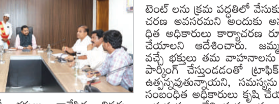
బెంట్ లను క్రమ వద్దటిలో చేసుకునేలా ప్రత్యేక కార్య చరణ అవసరమని అందుకు అనుగుణంగా సంబంధిత అధికారులు కార్యచరణ రూపొందించి అమలు చేయాలని ఆదేశించారు. జమ్మలమ్మ ఆలయానికి వచ్చే భక్తుల తమ వాహనాలను ఏకీకృతంగా ఉంచాలి. ప్రాధాన్యతను ఇచ్చారు. ధాన్యం కొనుగోలు ప్రక్రియను వేగవంతం చేయాలని కోరారు. ధాన్యం కొనుగోలు ప్రక్రియను వేగవంతం చేయాలని కోరారు. ధాన్యం కొనుగోలు ప్రక్రియను వేగవంతం చేయాలని కోరారు.

ప్రత్యేక కార్యచరణలో పరిశుభ్రతకు సహకరించాలి జమ్మలమ్మ భక్తులకు ఇబ్బందులు కలగకుండా చూడాలి ట్రాఫిక్ జామ్లను సమస్యను తగ్గించాలి కలెక్టర్ రిజ్వన్ బాషా షేక్