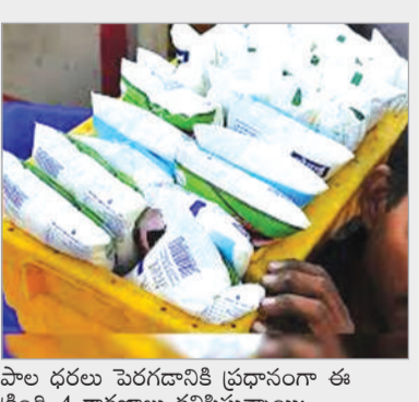
పాల ధరలు పెరగడానికి ప్రధానంగా ఈ క్రింది 4 కారణాలు కనిపిస్తున్నాయి:

నిత్యావసర ధరల పెరుగుదలతో సతమతమవుతున్న సామాన్యులకు దేశీయ దిగ్గజ డెర్లీ సంస్థ అమూల్ మరో చేదు వార్త చెప్పింది. అమూల్ ట్రాండ్స్ మార్కెటింగ్ చేసే గుజరాత్ కోఆపరేటివ్ మిల్క్ ప్రొడ్యూసర్స్ ఛైన్ లో అమూల్ పాల ప్యాకెట్లపై లీటరుకు రూ. 2 పెంచుతున్నట్లు ప్రకటించింది. దీంతో 500 మి.లీ అమూల్ గోల్డ్, అమూల్ శక్తి, అమూల్ తాజా ప్యాకెట్ల ధరలు ఒక్కో రూపాయి పెరిగాయి. అమూల్ బాటలోనే మరల డెర్లీ కూడా డిల్లీ-ఓజ్ = ఇతర ప్రాంతాల్లో లీటర్ పాలపై రూ. 2 పెంచుతున్నట్లు తెలిపింది. ఈ పెరిగిన ధరలను మే 14 నుండి దేశవ్యాప్తంగా అన్ని మార్కెట్లలో అమలులోకి వచ్చాయి.