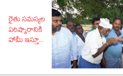
రైతు సమస్యల పరిష్కారానికి హామీ ఇస్తూ..

ఉపాధి హామీ పనుల్లో రికార్డు.. ఉపాధి హామీ పథకం ద్వారా వేలాది కార్మికులకు ఉపాధి కల్పించడంలో పాటు గ్రామీణ ప్రాంతాల్లో మౌలిక వసతుల నిర్మాణానికి ఊతమిచ్చారు.