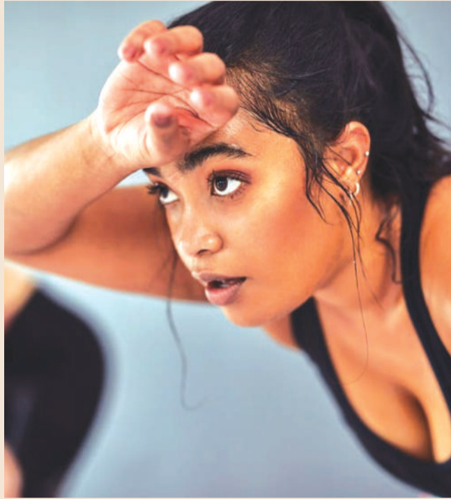
అవసరమైన దృష్టి అవసరం..

వేసవిలో తరచూ తలనొప్పి రావడం కూడా డీహైడ్రేషన్ సందేహాలకు నిపుణులు చెబుతారు. శరీరంలో ద్రవ సమతుల్యత దెబ్బ తింటే రక్తప్రసరణలో మార్పులు వచ్చి తలనొప్పి వచ్చే అవకాశం ఉంటుంది. ముఖ్యంగా ఎండలో ఎక్కువసేపు తిరిగిన తర్వాత వచ్చే తలనొప్పిని నిర్లక్ష్యం చేయొద్దని సూచిస్తున్నారు. మూత్రం గాఢ మెనుపు రంగులో కనిపించడం లేదా సాధారణం కంటే తక్కువ సార్లు మూత్రం విసర్జన జరగడం కూడా శరీరంలో నీటి కొరతకు సూచనగా భావించాలి. శరీరం నీటిని అదా చేసేందుకు ప్రయత్నించే సమయంలో మూత్రం మరింత కేంద్రీకృతమై ముదురు రంగులో కనిపిస్తుంది. నిపుణులు ప్రకారం మూత్రం రంగు ద్వారా శరీర హైడ్రేషన్ స్థాయిని సులభంగా అంచనా వేయవచ్చు. ఏకాగ్రత తగ్గడం, మతిమరపు, మెదడు మందగించినట్లు అనిపించడం కూడా డీహైడ్రేషన్ వల్ల కలిగే సమస్యలలో ఒకటి. శరీరంలో నీటి శాతం స్వల్పంగా తగ్గినా మెదడు పనితీరుపై ప్రభావం పడుతుందని అధ్యయనాలు చెబుతున్నాయి. దృష్టి కేంద్రీకృతంవడంలో ఇబ్బంది, స్వపంపం మందగించడం వంటి లక్షణాలు కనిపిస్తాయి.