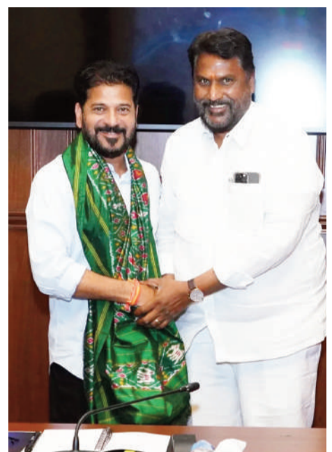
అధినేతనుండి ఆశీస్సులు తీసుకుంటూ..