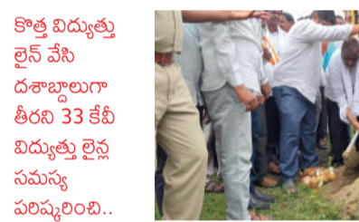
కొత్త విద్యుత్తు లైన్ వేసి రూ.భాటలుగా తీరని 33 కేబీ విద్యుత్తు లైన్లను సమస్య పరిష్కరించి..

మైనాల్ల సంక్షేమానికి ప్రాధాన్యం.. మైనాల్ల పరాల అభివృద్ధికి ప్రత్యేక దృష్టి సారినూ భవనాల నిర్మాణం, ఆర్థిక సాయం, ఉపాధి అవకాశాల కల్పనలో చురుకుగా వ్యవహరిస్తున్నారు.