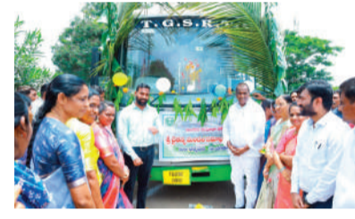
ఇందిరా మహిళా శక్తి పథకం కింద మహిళా సాధికారత దిశగా స్వచ్ఛ సంఘాలకు ఆర్థిక బిస్తు కేటాయింపు..

రహదారుల విస్తరణతో కొత్త రూపు.. ధర్మపురి నియోజకవర్గంలో ప్రధాన రహదారుల విస్తరణ, కొత్త రోడ్ల నిర్మాణం, గ్రామీణ రహదారుల అభివృద్ధితో రవాణా సౌకర్యాలు మెరుగుపడ్డాయి.