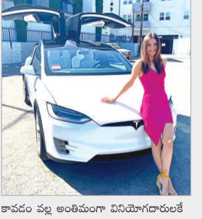
కాపడం వల్ల అంతిమంగా వినియోగదారులకే

పాటు భారతదేశంలో తన కార్ల శ్రేణిని కూడా టెస్లా పునరుద్ధరించుకుంది. కొత్త వేరియంట్లను ప్రవేశపెడుతూ పాత వాటి స్థానంలో మార్పులు చేసింది. గత కొన్ని నెలలుగా దేశీయ మార్కెట్లో ఈ కార్ల అమ్మకాలు చాలా మందకొడిగా సాగుతున్నాయి. భారీ ధరల కారణంగా చాలా మంది వాహన ప్రేమితులు ఇతర కంపెనీల వైపు మొగ్గు చూపారు. ఈ పరిస్థితిని అధిగమించేందుకు కంపెనీ యాజమాన్యం పూర్వోత్సాహంగా అడుగులు వేస్తోంది. టెస్లా తీసుకున్న ఈ నిర్ణయం వల్ల దేశంలోని ఇతర లగ్జరీ ఎలక్ట్రిక్ కార్ల కంపెనీలపై తీవ్ర ప్రభావం పడే అవకాశం ఉంది. ముఖ్యంగా టాటా, మహింద్రా వంటి స్థానిక సంస్థలతో పాటు జర్మన్ కార్ తయారీ సంస్థలకు ఇది గట్టి పోటీని ఇస్తుందని మార్కెట్ నిపుణులు భావిస్తున్నారు. ధరల యుద్ధం ప్రారంభం