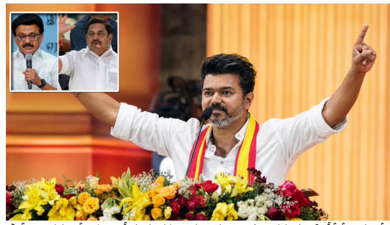
పార్టీల ఆధిపత్యంలో ఉన్న రాజకీయ చరిత్రను తిరగరాస్తూ, నటుడు విజయ్ స్థాపించిన తమిళకం వెట్టి కళగం (టీవీకే) చారిత్రక విజయం దిశగా దూసుకెళ్తుంది. తొలిసారి ఎన్నికల అరిలోకి దిగి, అధికారాన్ని కైవసం చేసుకునే అంచన నిలిచి, దేశవ్యాప్తంగా సంచలనం సృష్టించింది. ఫ్యాన్ ఫోలో... ఫలితాలు 2026 తమిళనాడు అసెంబ్లీ ఎన్నికల ఫలితాల్లో 1962లో కె. కామరాజ్ నేతృత్వంలోని

చెన్నై, మే 4 (నినాదం): తమిళనాడు రాజకీయాల్లో ఒక ఉరిహించని భాగస్వామి... ఎవరూ అంచనా వేయని ఒక అద్భుతమైన స్థితి ఆవిష్కరమైంది. ఆరు దశాబ్దాల పైగా ప్రవి