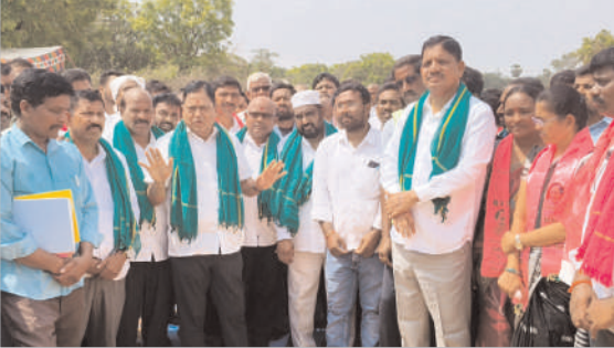
పంటను అమ్ముకోవడంలో కూడా రైతులు ఎంతో ఇబ్బందులకు గురవుతున్నారని, కాంగ్రెస్ ప్రభుత్వం పట్టణంకోసం లేదన్నారు. రైతులకు పంట వదిలించడం అధిక ఖర్చులతో కూడిన భారం అవుతుంది, అందులో ధాన్యం అమ్ముకోవడంపై తీవ్ర

ధాన్యం కొనుగోలులో జప్తం వహిస్తున్న ప్రభుత్వం ఇబ్బందులకు గురవుతున్న రైతులు మాజీ మంత్రి రెడ్డిచిరంజన్