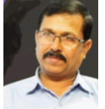
జంపన్న దేవాలయం సోషల్ సెక్షన్

తరుణంలో, నికచ్చిగ్గా నిజాలను బయటపెట్టడం ద్వారా వ్యవస్థాగత మార్పుకు మీడియా పునాది వేయాలి. సమాచారం అనేది లాభం ఆర్జించే వస్తువు కాకుండా, ప్రజలందరికీ అందుబాటులో ఉండే ప్రజా ఆస్తిగా మారాలి. ప్రమాదపూరిత పక్షం వహించి, వ్యవస్థలోని లోపాలను సరిచేసే దిశగా సాగి జర్నలిజం నేటి అవసరం.