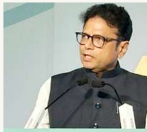
nasscom GCC Summit 2026