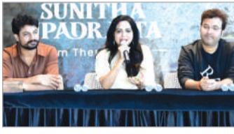
మాట్లాడుతూ, తరతరాల ప్రేక్షకులను ఆకట్టుకున్న సరయుగ గీతాలతో పాటు నేటి మోడ్రన్ కుడా ప్రత్యేకంగా