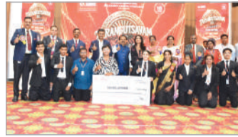
ప్రతిభను చూసి ఆమె ప్రశంసలు కురిపించారు. సాంస్కృతిక కార్యక్రమంలో విద్యార్థులు సృజనాత్మక, సంగీత ప్రదర్శనలు, వినోదాత్మక కార్యక్రమాలతో ప్రేక్షకులను అలరించారు. కార్యక్రమంలో అధ్యాపకులు, విద్యార్థులు మరియు పలువురు అతిథులు పాల్గొన్నారు. ఈ