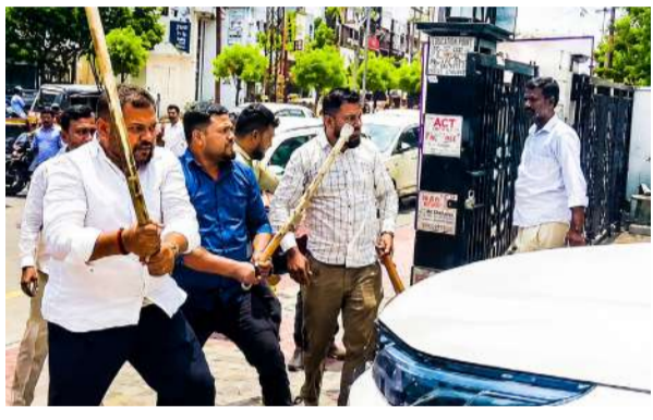
(నినాదం - స్టేట్ బ్యూరో):