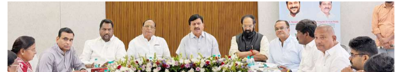
హైదరాబాద్, మే 7 (నినాదం):