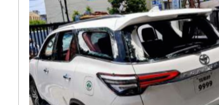
దాడిలో ధ్వంసమైన కారు

ఈ నెల మొదటి వారంలో కఠినంగా లో ఓ సగల షాపులో జరిగిన డోపిడీకి సంబంధించి బాధితులను పరామర్శించడానికి బీఆర్ఎస్ పర్సన్ డెవలప్ మెంట్, మాజీ మంత్రి కేసీఆర్ కఠినంగా కు వచ్చిన సందర్భంగా... కఠినంగా లో శాంతి భద్రతలపై, బండి సంజయ్ మీద 'కాందికీకులు, డ్రగ్స్