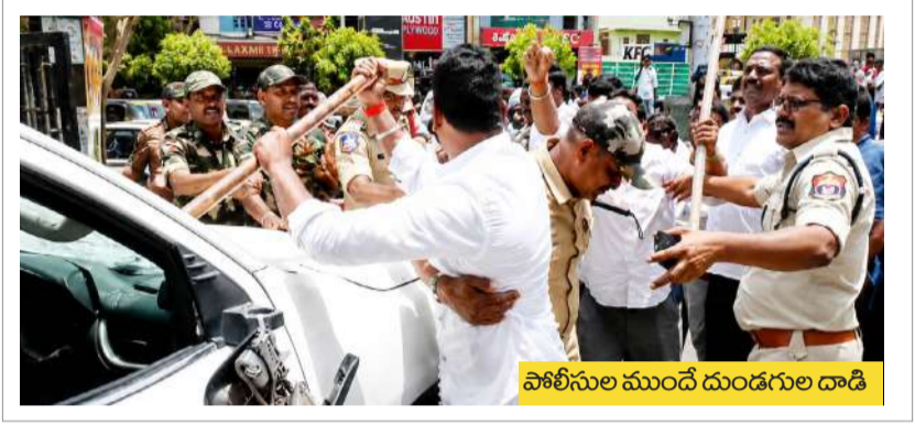
పోలీసుల ముందే దుండగుల దాడి

కఠినంగా పట్టణంలో పాటు హుజూరాబాద్ లోని కౌశిక్ రెడ్డి కార్యాలయంపై కూడా దాడికి తెగబడ్డారు కాగా పోలీసులు ఈ వ్యవహారాన్ని పెద్దగా పట్టించుకోలేదు. వాహనాన్ని కార్యాలయాన్ని ధ్వంసం చేస్తున్న సమయంలో సైతం శాంతి భద్రతలు అదుపుతున్నారని సోయ పోలీసులకు లేకుండా పోయింది. రోడ్లపై శాంతియుతంగా ధర్నాలు, ఆందోళనలు చేసే ప్రజలను లాఠీతో హడలెత్తించే పోలీసులు... ఇంతగా క్రమంలో దాడులు జరుగుతున్నప్పటికీ అలా చూస్తూ ఉండిపోయారు. ఏకంగా కేంద్ర హోం శాఖ సహాయ మంత్రి బండి సంజయ్ స్వయంగా దాడికి ప్రేరేపించినట్లు గంగుల కమలాకర్, పాడి కౌశిక్ రెడ్డిలు ఆరోపిస్తున్నారు.