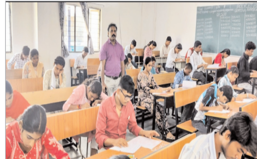
సమస్యలతో విజయవంతం అయింది పేర్లన్నారు.